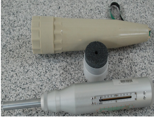
Concrete test hammer