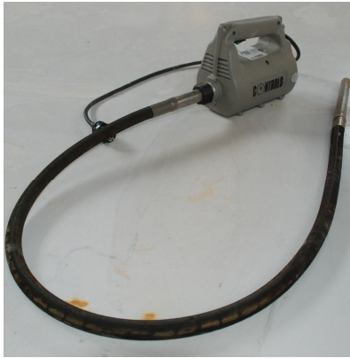
Vibrating poker ۲۲mm dia * ۲۵۰mm long tip