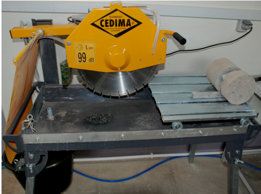
Saw bench for cylinder

نام دستگاه(فارسی): دستگاه برش مته الماسه ای