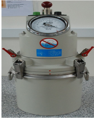
Air entrainment meter "B" type