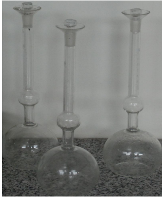
le chatelier soecific fask with a glass stopper chattaway spatula ۱۲۵mm