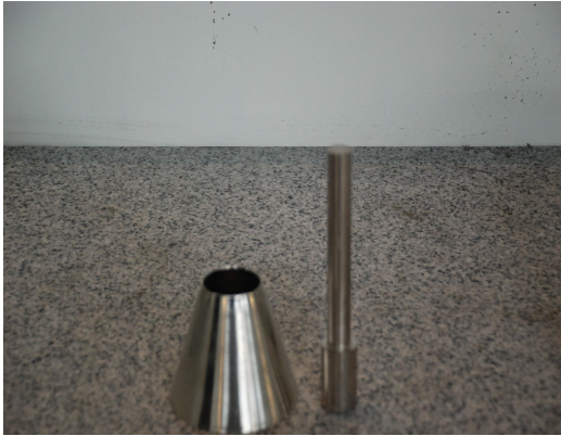
Sand absorption cone –tamping rod

نام دستگاه (فارسی): تعیین رطوبت سطحی ماسه