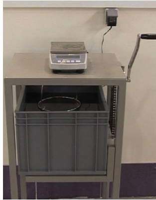
Buoyancy balance- oven