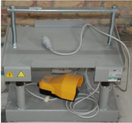
Vibrating table ۶۲۵mm * ۳۱۳mm