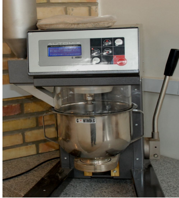
Mortar mixer 5 liter automatic

نام دستگاه (فارسی): مخلوط کن اتوماتیک سیمان